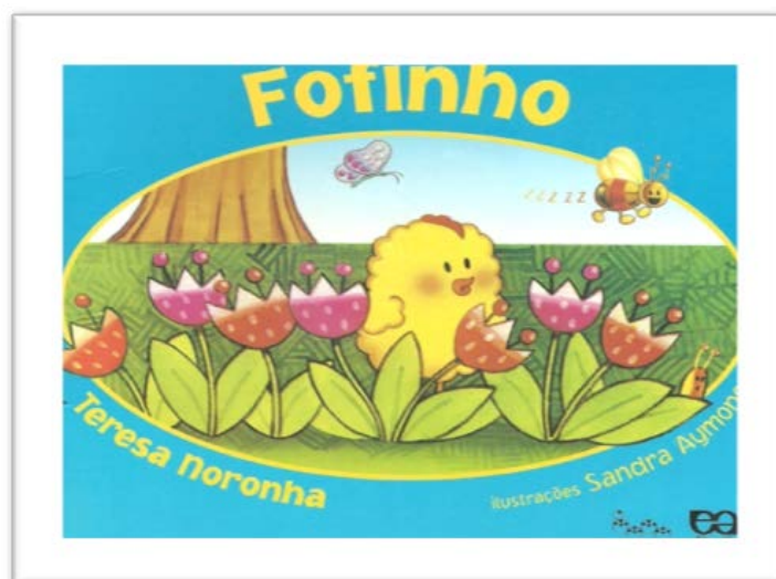
Figura 1 - Capa do livro de literatura

A literatura selecionada foi o livro “Fofinho”, escrito por Teresa Noronha (2009). Essa história retrata a vida de um pintinho, Fofinho, que nasceu em uma incubadora e, em razão disso, não conhecia sua família e resolveu sair à procura dela. No enredo da história Fofinho vai encontrando vários animais e objetos, que ele pensa que são sua família. A grande questão da história é: será que Fofinho seria da família do pato, do cachorro, do balde, do pássaro, da abelha ou da galinha? Essas são dúvidas que o pintinho enfrenta até descobrir de fato quem ele é e quem é sua família.