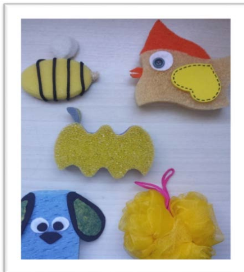
Figura 3 - Esponjas caracterizando os personagens

emocional direta entre eles e a professora. Também, a partir da história, confeccionamos recursos capazes de garantir que os bebês vivenciassem ricas experiências olfativas, gustativas, auditivas, visuais e táteis, provocando novas relações e interesses com o conteúdo a ser apreendido. Assim, a manipulação sensorial dos personagens da história provocou sensações diversas: esponjas macias, ásperas, finas, grossas, etc., são alguns exemplos do material produzido, como ilustra a imagem abaixo.