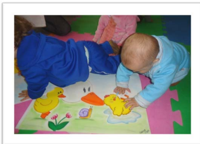
Figura 4 - Situação de ensino aplicada com os bebês

Para fins de apresentação do resultado da pesquisa sobre essa atividade de ensino, detalharemos a sequência didática da contação de história do livro. Assim, no grupo em que as crianças exploraram e tocaram nas imagens do livro, a ação didática seguinte foi a intervenção e direção da atenção dos bebês para as propriedades dos objetos e imagens que compõem a referida história, dentre elas, as relações entre as diferentes grandezas matemáticas: comprimento, quantidade, distância e tempo; e também o som produzido pelas imagens da história e as diversas texturas: áspero, liso, macio e duro.