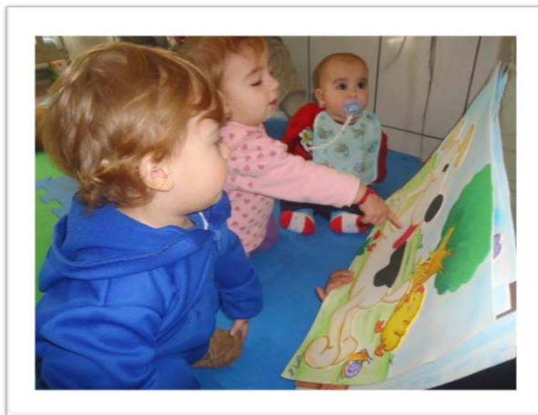
Figura 5 - Bebês interagindo com as cenas da história

Na ação compartilhada entre o bebê e o adulto deve-se explorar as diferentes sensações da criança, possibilitando experiências com diversas imagens, sons, texturas, sabores, cheiros e etc. Além das sensações visuais, auditivas, táteis, gustativas e olfativas, Sokolov (1960) destaca a importância das sensações motoras ou cinéticas, responsáveis por captar os movimentos, a posição dos objetos e das pessoas. O desenvolvimento dessas sensações depende das condições concretas de vida possibilitadas aos sujeitos desde sua concepção. Por isso, cabe ao adulto organizar diferentes situações que produza na criança a necessidade de explorar as diferentes sensações. Para Mukhina (1996, p. 51), “[...] o papel diretivo do ensino no desenvolvimento psíquico da criança manifesta-se no fato de que a criança assimila novas ações, inicialmente orientada e ajudada pelo adulto, depois sozinha”. Na imagem a seguir, a professora segura a imagem do livro e vai contando a história, e é nítido o interesse tanto pelo toque nas figuras, quanto pela contação da história realizada pela professora.