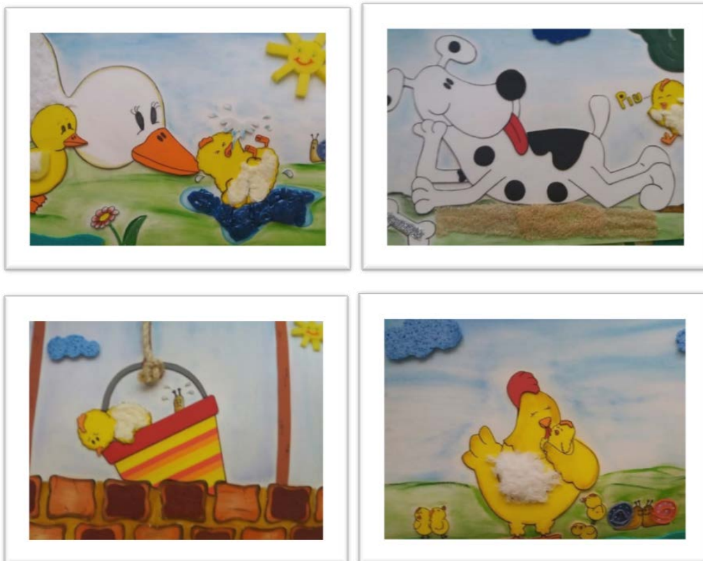
Figura 2 - Imagens da história recriadas com texturas

Para o estabelecimento da relação entre a atividade de ensino organizada pelo professor e a atividade de aprendizagem dos bebês foi preciso reproduzir a história, em um papel maior, com diferentes texturas e cores que permitissem novas ações com a história. A seguir apresentamos algumas imagens do livro produzido com diferentes texturas. Enfatizamos a diversidade de material tátil e visual empregada na reprodução dos personagens e do ambiente que compõe cada conflito vivenciado por Fofinho.