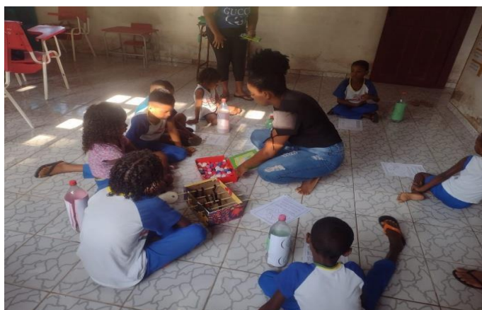
Figura 9: Distribuições de brinquedos /jogos na escola municipal Ladeira

Com a finalização das atividades, foram distribuídos, entre os alunos, jogos e brinquedos, como o jogo da memória, ilustrado pelas figuras 8 e 9. O jogo foi construído a partir de materiais recicláveis como caixa de sapato, palito de churrasco e prendedor de roupa. Além disso, coletamos mais de cinquenta tampinhas de garrafas pet e adicionamos imagens de animais para confecção do jogo da memória com o intuito de sensibilizar as crianças a fim de despertar as suas criatividade por meio dos brinquedos. Nesse sentido, Alves (2012, p. 1) afirma que se “[...]verificasse a importância de conscientizar e sensibilizar as crianças nas escolas sobre as formas de separação do lixo e fazer a reutilização de materiais recicláveis construindo brinquedos e jogos didáticos”.