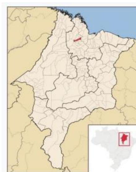
Figura 1: Localização do município de São Bento –MA

A pesquisa foi desenvolvida nas Escolas Municipais Ladeira e Nossa Senhora da Conceição, pertencente ao município de São Bento no Estado do Maranhão, o município está localizado na latitude 02°41'45" sul e a uma longitude 44°49'17" oeste, estando a uma altitude de 2 metros a nível do mar (Figura 1).