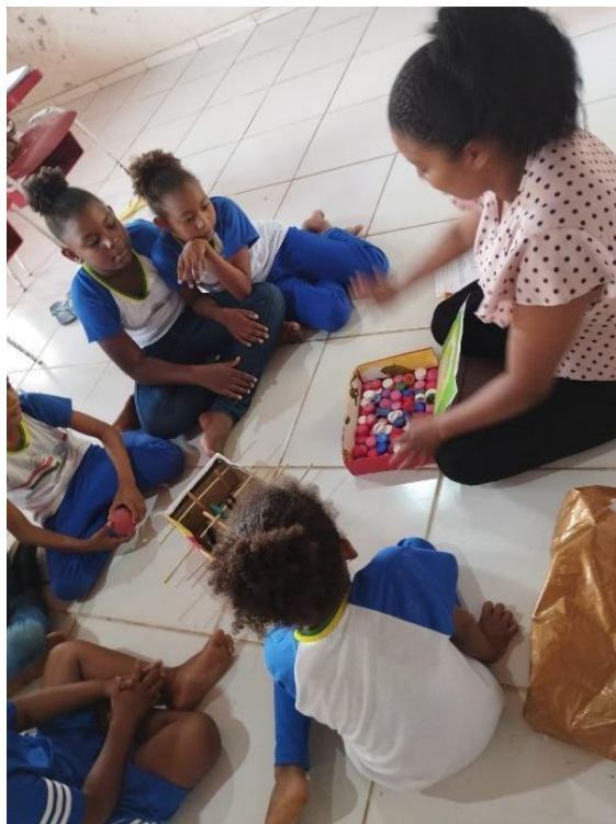
Figura 10: Distribuição de jogos /brinquedos na Escola Nossa Senhora da Conceição

A utilização de jogos e brinquedos para chamar a atenção do público infantil é um dos métodos pelos quais se prende a atenção das crianças. Nesse sentido, segundo Tibúrcio (2013, p. 6) “a utilização de jogos lúdicos facilita e promove o conhecimento”, portanto, devem ser estabelecidas e definidas estratégias que atuem em função da proposta pedagógica planejando dentro de um determinado tempo e espaço. Dessa forma, o segundo brinquedo apresentado na figura 9, o boliche construído a partir de garrafas pet e decorados com figuras e distribuídos nas escolas proporcionou um momento lúdico com as crianças atendendo atenção do público infantil masculino nas brincadeiras.