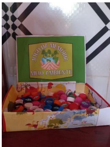
Figura 11: Jogo da memória

promover um momento de diversão entre elas, que através de pequenas coletas estariam promovendo um impacto positivo para o meio ambiente.