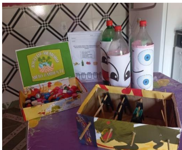
Figura 12: Todos os jogos e brinquedos