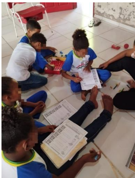
Figura 7: Atividades - Escola Nossa Senhora da Conceição