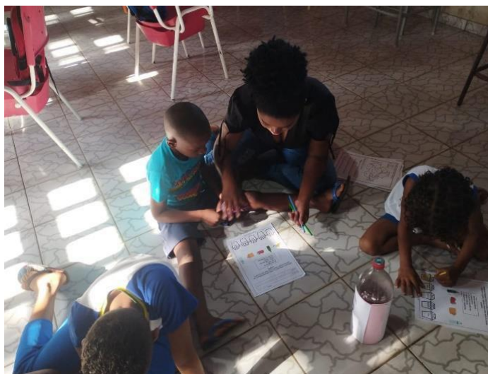
Figura 6: Atividade com a Escola Municipal Ladeira

Na segunda escola durante o momento inicial, de onze alunos, somente quatro responderam e interagiram; os outros sete alunos não souberam responder. Em seguida, foram aplicadas as atividades lúdicas conforme a figura 6, referente ao meio ambiente, nas quais os aprendizes tinham que ligar e pintar conforme a temática ambiental pedida nas atividades.