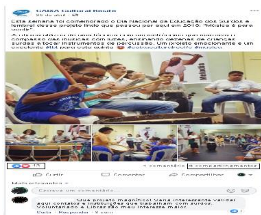
Figura 1 – Postagem de um evento da CAIXA Cultural Recife.

Esse compartilhamento está relacionado à métrica de influência, como vimos citados por Polvora (2009), esse indicador permite avaliar o quanto a página está sendo compartilhada e divulgada no meio social e o quanto ela é influenciadora, vimos que a mesma tornou-se capaz de influenciar seus seguidores, de modo que divulgassem o conteúdo por ela postado.