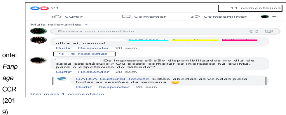
Figura 2 - Comentários da postagem “BR TRANS” da CCR no mês de fevereiro

E ainda na mesma postagem podemos notar a interação da página com um usuário, mantendo a mediação da informação, uma vez que, esses canais são dispositivos importantes para comunicação, divulgação de informações e esclarecimentos de dúvidas. Esse contato com os usuários permite com que sintam-se confortáveis ao serem correspondidos, ao interagir por meios dos comentários as necessidades informacionais dos usuários são atendidas. Diante das métricas analisadas, nota-se que o engajamento da página não é muito satisfatório, a página possui usuários dispostos a interagirem, contudo, falta uma estratégia capaz de motivá-los a serem mais engajados.