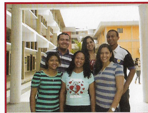
Comissão de Comunicação