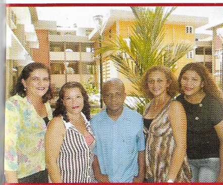
Comissão de Finanças e Patrocínio