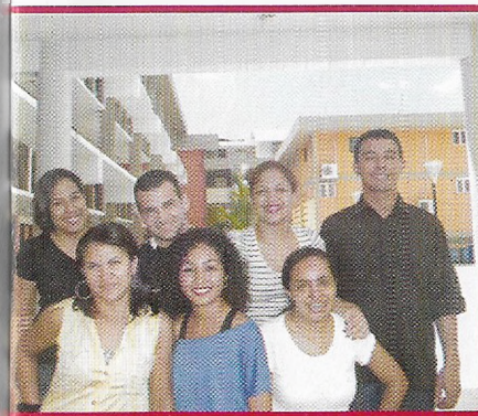
Comissão de Editoração