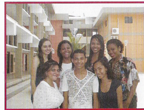
Comissão de Captação de Originais