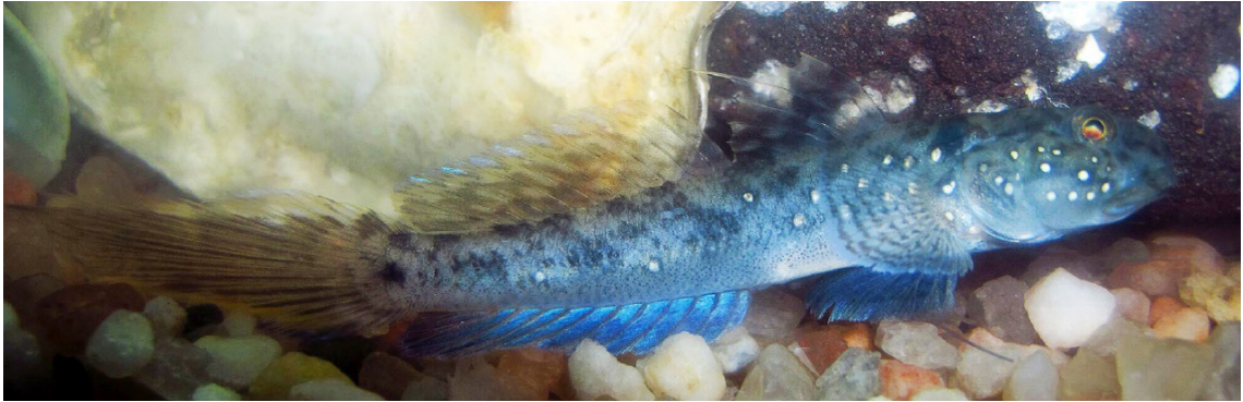
Figure 1. Ctenogobius smaragdus : CICCAA 00203, 69.8 mm SL specimen; Raposa Channel Estuary, Maranhão State, Brazilian Amazon Coast.