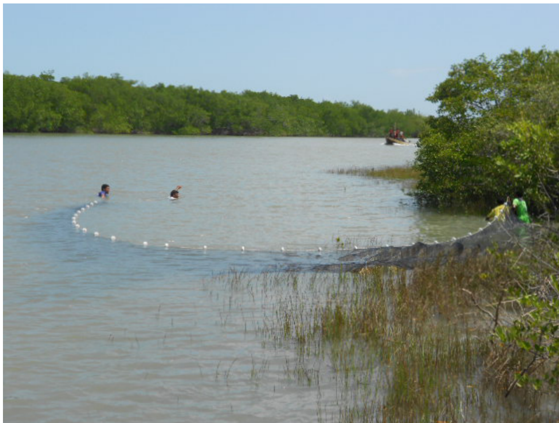
Figure 3. Collecting site of Ctenogobius smaragdus ; Raposa Channel Estuary, Maranhão State, Brazilian Amazon Coast.