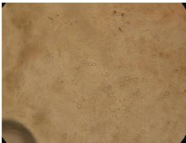
Figura 3 – Doença de Jorge Lobo – achados do exame micológico: presença de células fúngicas esféricas, de paredes espessas, hialinas, formando correntes simples e ramificadas, com elementos ligados uns aos outros por conexões tubulares

No ambiente da floresta equatorial, com clima quente e úmido, o fungo vive como saprófita e, embora não esteja completamente esclarecido o mecanismo de infecção humana, é possível que traumatismos com fragmentos vegetais, assim como soluções de continuidade pré-existentes tenham papel nesse mecanismo (BARUZZI; OPROMOLLA, 2013, p.1218). O caso ora relatado apresenta dados que corroboram aqueles da literatura, destacando-se o fato de o paciente residir e exercer atividades laborais em áreas rurais de municípios situados na região da pré-amazônia maranhense e no Estado do Pará, cujas características fisiográficas são propícias à manutenção do fungo na natureza.