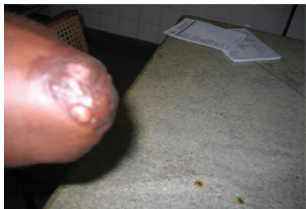
Figura 1 – Doença de Jorge Lobo - lesões infiltrativas e nodulares no cotovelo

A literatura registra 490 casos da doença de Jorge Lobo no mundo, sendo 318 do Brasil (BRITO; QUARESMA, 2007, p. 475). É considerada uma doença típica da região amazônica, de onde são procedentes os casos descritos em nosso país (OPROMOLLA et al., 1999, p. 135). Predomina em pessoas que exercem atividades rurais como agricultores, seringueiros, garimpeiros, o que lhe confere um caráter ocupacional (BRITO, QUARESMA, 2007, p. 475). Diversos grupos étnicos são acometi-