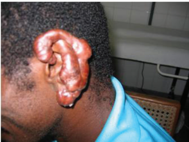
Figura 2 – Doença de Jorge Lobo – lesões infiltrativas e nodulares no pavilhão auricular

Na investigação de dados epidemiológicos, o paciente referiu ter residido, por tempo variado, nas localidades de Água Preta, Quinto Braço, Manguari, nos municípios de Vitória do Mearim, Zé Doca e São João do Carú, respectivamente, situados na região centro-oeste do Estado do Maranhão. Aos 18 anos esteve, por três meses, no município de Paragominas (PA), onde trabalhou em uma fazenda, retornando