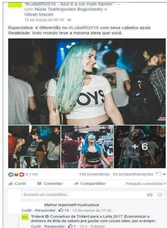
Figura 2 – Post e descrição sobre os participantes do Festival Lollapalooza.