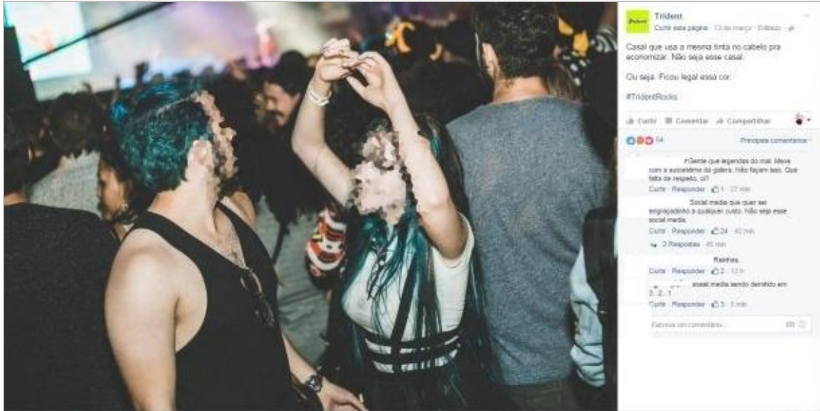
Figura 1 – Imagem postada e descrição dos participantes do festival Lollapalooza.