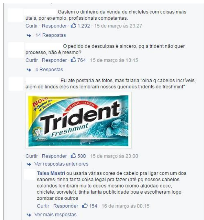
Figura 6 – Comentários do pedido de desculpas da Trident em seu Facebook.