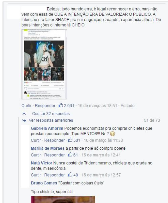
Figura 5 – Comentários do pedido de desculpas da Trident em seu Facebook.