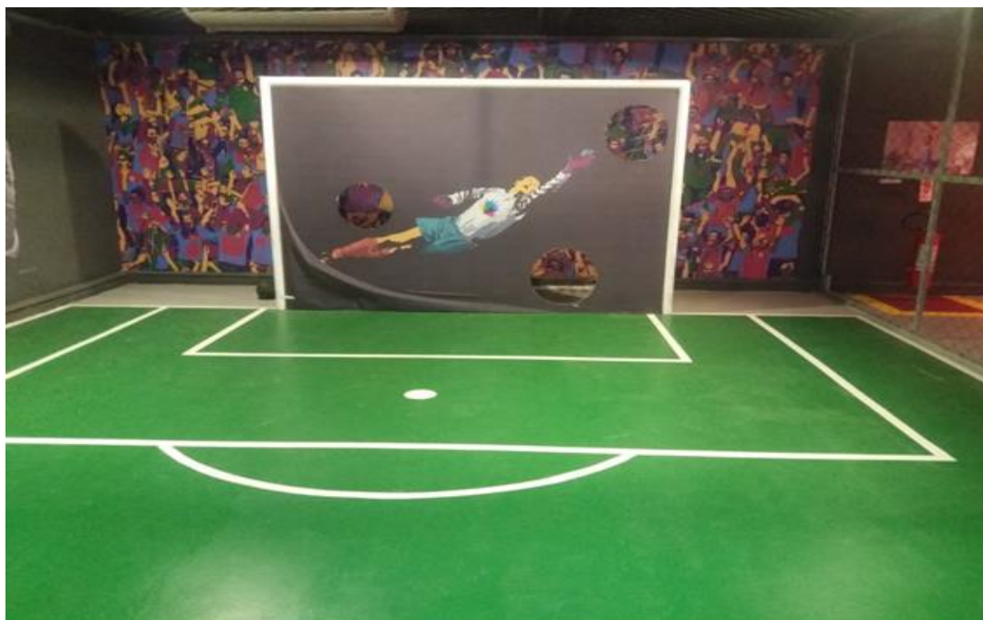
Figura 2 - Quadra de Futebol de cinco da Exposição Movimente-se: A Física dos esportes (Museu Ciência e Vida)

O Futebol de cinco é um jogo para cegos e/ou deficientes visuais. Os jogadores usam uma venda nos olhos e não podem tocá-la, assim, todos os visitantes podem participar da proposta. A bola utilizada no jogo tem guizos internos para que os atletas consigam localizá-la. A torcida só pode se manifestar na hora do gol. A Figura 2 mostra como essa parte da exposição foi montada.