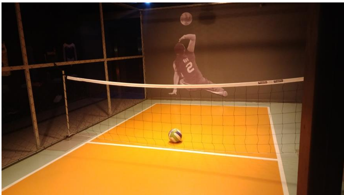
Figura 3 – Quadra do Vôlei sentado da Exposição Movimento-se: A Física dos esportes (Museu Ciência e Vida).

O outro módulo analisado foi o vôlei sentado que surgiu da junção do vôlei convencional com um esporte alemão praticado por pessoas com pouca mobilidade, mas sem rede, chamado “sitzbal”. Podem competir no vôlei sentado jogadores amputados, paralisados cerebrais, lesionados na coluna vertebral e pessoas com outros tipos de deficiência locomotora nas Paraolimpíadas. Esse módulo foi construído para que os visitantes participem de uma partida sentados (Figura 3).