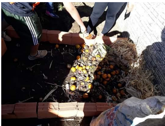
Figura 5 – Construção da Composteira na Escola, Alfredo Wagner, SC.