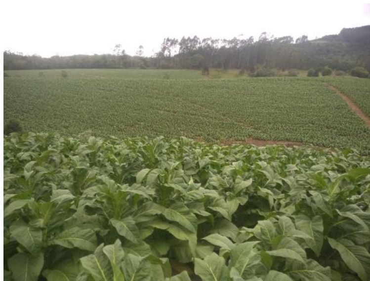
Figura 1 - Plantação de Fumo na localidade de Barro Branco, Alfredo Wagner, SC.