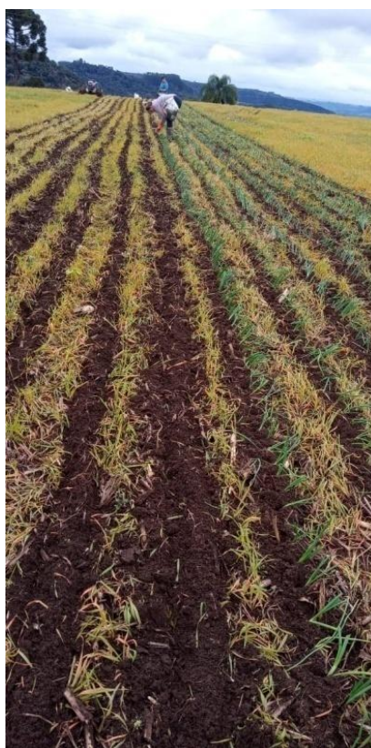
Figura 2 - Plantação de Cebola na localidade de Pinguirito, Alfredo Wagner, SC.