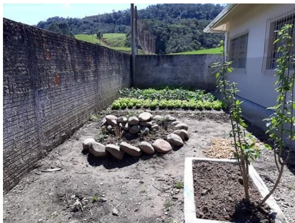
Figura 4 – Horta da Escola, em Alfredo Wagner, SC.