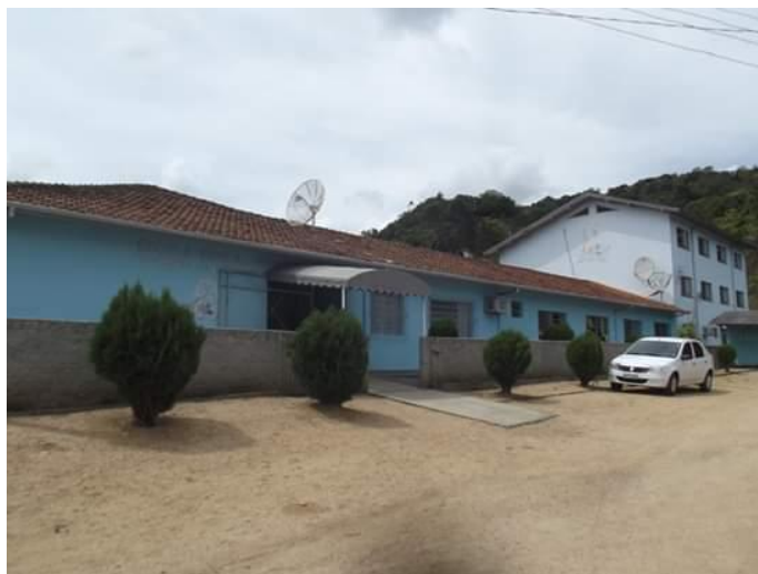
Figura 3 - Escola Básica Passo da Limeira, Alfredo Wagner, SC.

A escola existe no formato atual desde o ano 2000, isso porque, com o fechamento de escolas multisseriadas no interior do município, muitos estudantes foram remanejados para esta escola que se configura como um espaço de centralização dos estudantes da região.