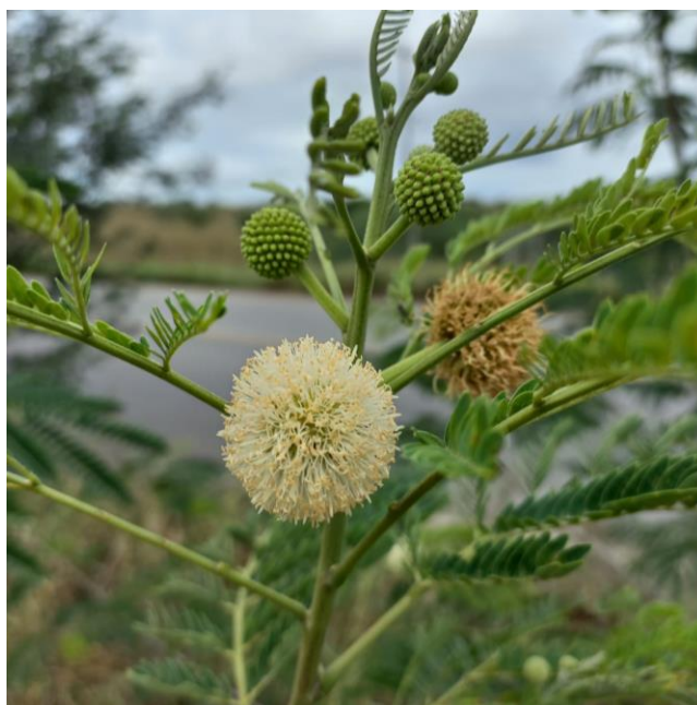
Figura 1: Leucaena leucocephala (Lam.) de Wit (Fabaceae) no local de coleta.

Leucaena leucocephala (Lam.) de Wit (Figura 1) é uma espécie exótica invasora no Brasil que possui potencial alelopático (QUEIROZ, 2020). Para este estudo, foram coletadas folhas de 10 indivíduos adultos aleatórios da espécie. O material coletado foi armazenado no laboratório em sacos plásticos em câmara fria a 5 °C.