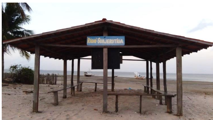
Figura 1: Rádio da Ilha De Guajerutua

Citamos no local estudado uma estratégia singular de reivindicação por meio de espaços de diálogo: os denominados “rádios” (Figura 02). De acordo com uma das lideranças entrevistadas, cada uma das treze comunidades habitadas tem o seu rádio, que pode ser “desde uma casa, um banco, até o pé de uma árvore”. Nesses locais, todos os dias, com hora marcada, são debatidos assuntos de interesse público e da esfera privada. Em uma dessas ocasiões tornou-se público que uma pescadora havia sofrido violência doméstica e outra havia sofrido violência física 17 pelo esposo, que desejava proibi-la de comparecer a uma reunião (ENTREVISTA, 2022).