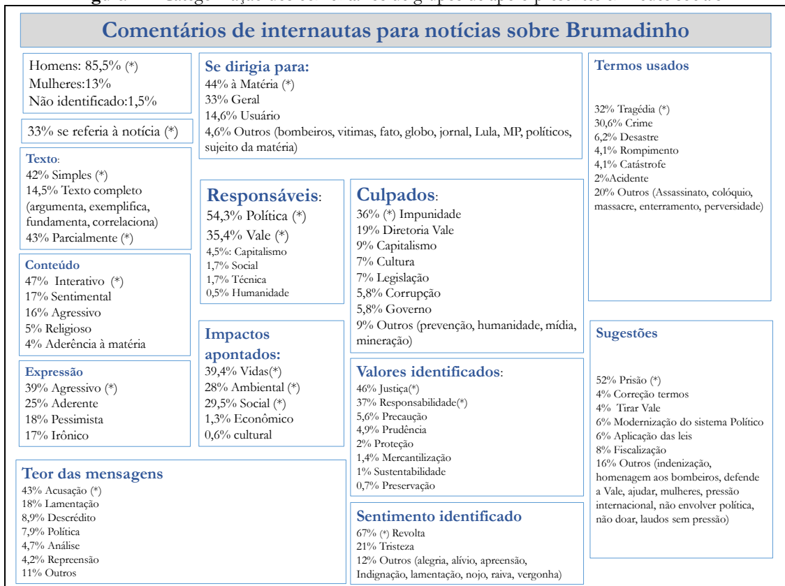
Figura 2 – Categorização dos comentários de grupos de apoio presentes em redes sociais

Os valores foram comparados entre as categorias por meio do teste goodness-of-fit ; os valores significativamente maiores ( p < 0,01 ) estão acompanhados de asterisco (*).