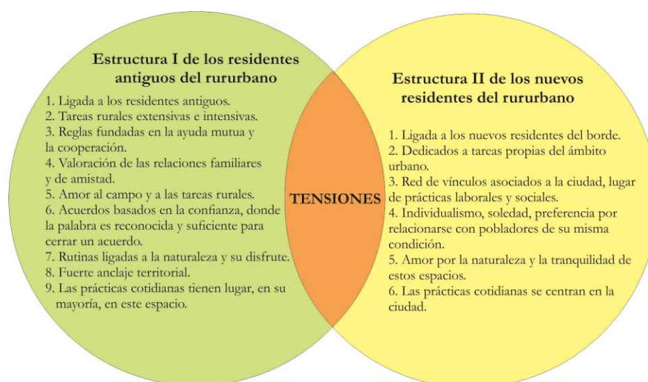
Figura 2: Encuentro de estructuras sociales en el rurbano bahiense

El encuentro entre estas dos estructuras, produce tensiones y desencuentros, tal como se desarrolla en el siguiente apartado. Sin embargo, es interesante observar como cada una, en especial la primera, busca permanecer y resistir ante los embates de la expansión urbana, pues cada residente se debate entre sus anhelos y perspectivas futuras y la realidad de una ciudad que avanza, de políticas locales que no contemplan los intereses y necesidades de los pobladores de estos bordes y de exigencias económicas que, en ocasiones, no pueden sobrellevar con sus medios y recursos que disponen (figura 2).