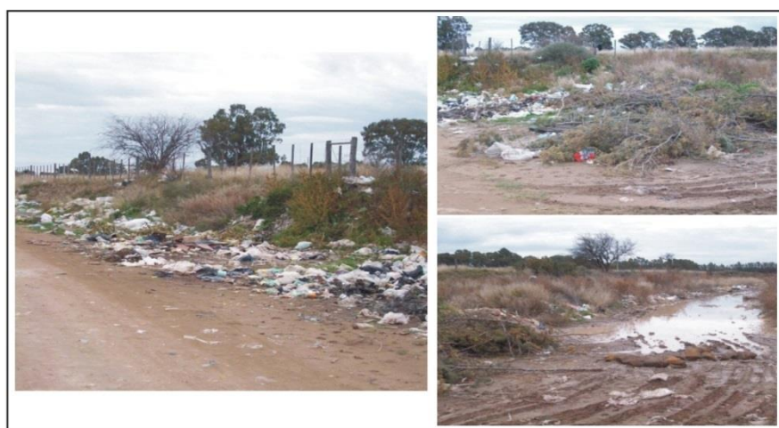
Figura 4: Basurales en los accesos al sector oeste del rururbano bahiense

La tabla I sintetiza los conflictos mencionados, identificando actores, intereses y acciones de cada uno. Este cuadro se realiza sobre la base de los comentarios de los entrevistados, la recopilación de artículos periodísticos de actualidad y de informes locales sobre la temática.