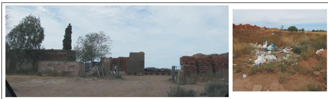
Figura 5: Paisaje de Hornos de ladrillo en el sector Norte del rururbano bahiense