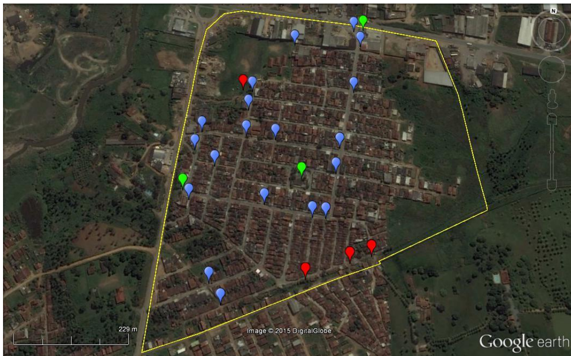
Figura 6 – Espacialização dos depósitos de resíduos sólidos (azul), pontos de degradação ambiental (vermelho) e indicações para instalação dos PEV's (verde) no Bairro de Redenção. Elaboração: David Azevedo, 2015 (Base: DigitalGlobe - Google Earth, 2015).

Adicionalmente se propõe para o bairro a instalação de Pontos de Entrega Voluntária (PEVs) em locais estratégicos, visando a deposição do lixo reciclável para posterior coleta pelos catadores de material reciclável ou caminhão específico, para seu beneficiamento. Os PEVs deverão ser acrescentados à medida que a população responda corretamente ao seu uso (Figura 7).