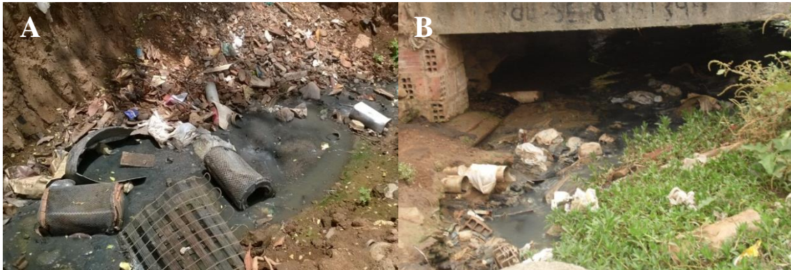
Figura 4 – Resíduos sólidos, causando poluição ambiental em cursos de água ao norte (A) e ao sul do Bairro de Redenção(B).