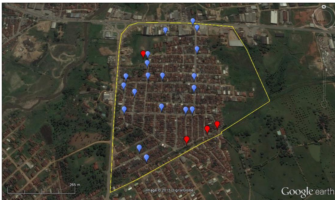
Figura 3 – Espacialização dos depósitos de resíduos sólidos para coleta convencional (azul) e pontos de degradação ambiental (vermelho) no Bairro de Redenção. Elaboração: David Azevedo, 2015. (Base: DigitalGlobe - Google Earth, 2015).

A partir das visitas realizadas à localidade, foi possível identificar que existem atualmente 23 pontos de deposição de resíduos sólidos para coleta convencional, dos quais quatro foram considerados pontos críticos de degradação ambiental devido à proximidade destes com cursos de água e a presença constante de resíduos diversos, inclusive resíduos perigosos. Todos os pontos foram georreferenciados e espacializados em um mapa, destacando-se os pontos críticos dos demais através de cores. Este mapa (Figura 3) orientará o serviço público (Secretaria de Serviços e Agência de Meio Ambiente) e a empresa responsável pela limpeza urbana no município (LOCAR Saneamento Ambiental) a tomar as providências cabíveis no sentido de melhorar o gerenciamento de resíduos sólidos no bairro.