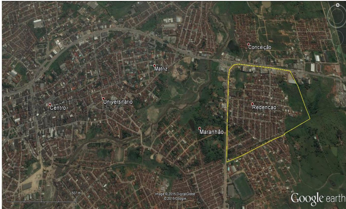
Figura 2 – Delimitação da área de estudo na zona urbana do município: Bairro de Redenção. Elaboração: David Azevedo (2015), base de dados - DigitalGlobe (Google Earth), 2015. Imagem Quickbird, 2011.

O bairro de Redenção está localizado no centro urbano do município, é constituído por 751 domicílios particulares permanentes e 2.461 residentes, de acordo com o último censo do IBGE.