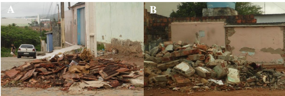
Figura 5 – Resíduos sólidos de Construção e Demolição dispostos em vias públicas, ambos na rua principal do Bairro de Redenção (A e B).

As principais fontes geradoras dos resíduos foram relacionadas quanto aos tipos de resíduos gerados (Papel/papelão, Plástico, Vidro, Metal, Orgânicos, Resíduo de Construção e Demolição, Óleos, Resíduo Eletroeletrônico, Pilhas e Baterias, Resíduos de Serviços de Saúde). Foi elaborado um quadro (Quadro 2) que mostra esta relação, associando às diversas atividades desenvolvidas no bairro.