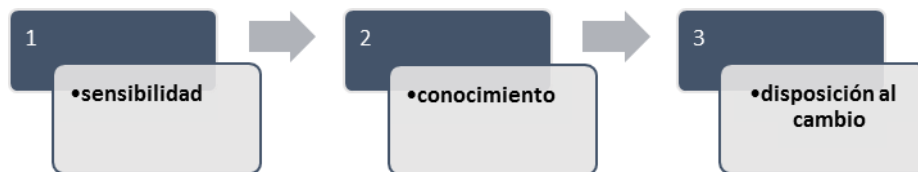
Figura 3 – Triada de contenido de preguntas

El contenido de las preguntas se hizo en función de los aspectos se pretendían analizar (Figura 3), que corresponden a la triada: