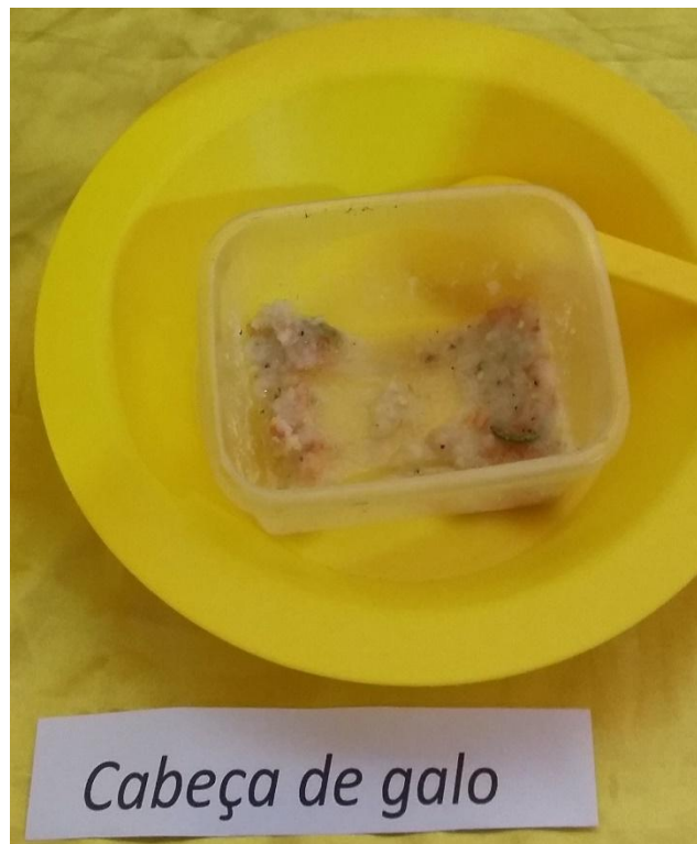
Figura 2: Cabeça de galo

3 - O CABEÇA DE GALO é uma espécie de tempero preparado com sal e pimenta do reino, socado no pilão. Em seguida, coloca-se essa mistura em um prato com água e suco de limão, além de pimenta malagueta esmagada, que são ingredientes facilmente encontrados no quilombo. Geralmente, o “cabeça de galo” é utilizado como aperitivo para se comer com peixe. Muito utilizado na Semana Santa quando as famílias quilombolas se reuniam para jantar.