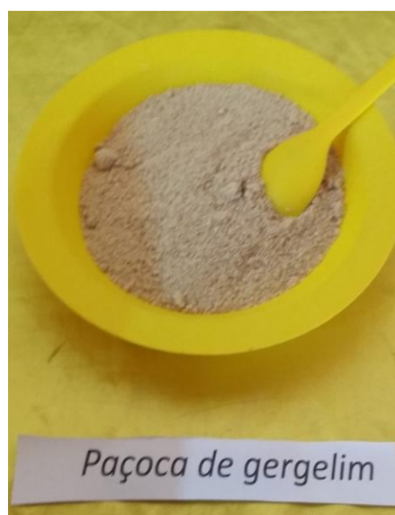
Figura 4: Paçoca de gergelim

6 - A PAÇOCA DE GERGELIM - o prato passa por dois momentos importantes para o seu preparo: no primeiro momento, o gergelim, que é uma semente, deve ser bem torrado; no segundo momento, estando todo ele torrado, deve ser socado no pilão juntamente com farinha e açúcar, podendo este último ingrediente ser substituído por rapadura, que era o mais comum na época.