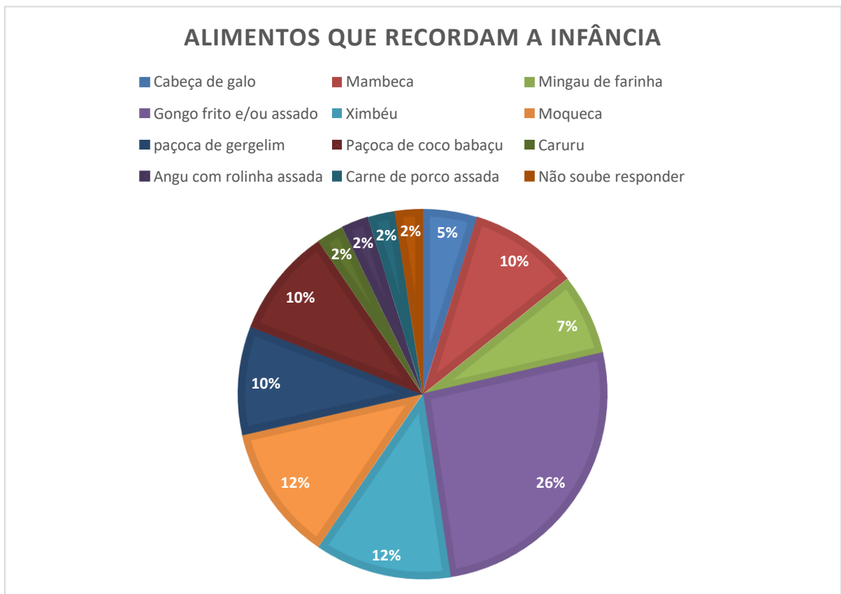
Gráfico 2: Comidas que remetem às lembranças da infância

Segundo Certeau (2008) “são nas práticas que são reveladas a cultura e identidade de grupos e sujeitos” (p. 234). A produção do alimento é um ato social que evidencia aspectos da organização de determinado grupo. Além de sua característica cultural, a comida pode despertar no indivíduo ou grupo momentos de recordação de tempos já vivenciados. Dessa forma, perguntou-se sobre quais pratos de comida lhe fazem lembrar sua infância, onde foi respondido o seguinte: