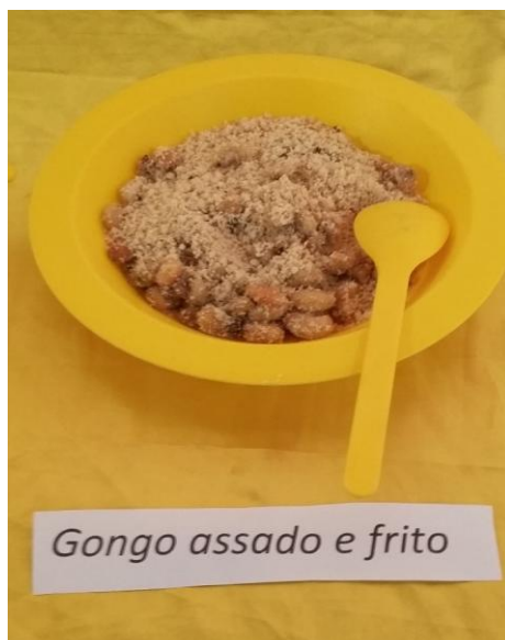
Figura 5: Gongo assado e frito

8 – Gongo assado e frito – Prato típico do quilombo que é feito do próprio gongo extraído do coco, e o mesmo pode ser feito de duas formas assado e frito.