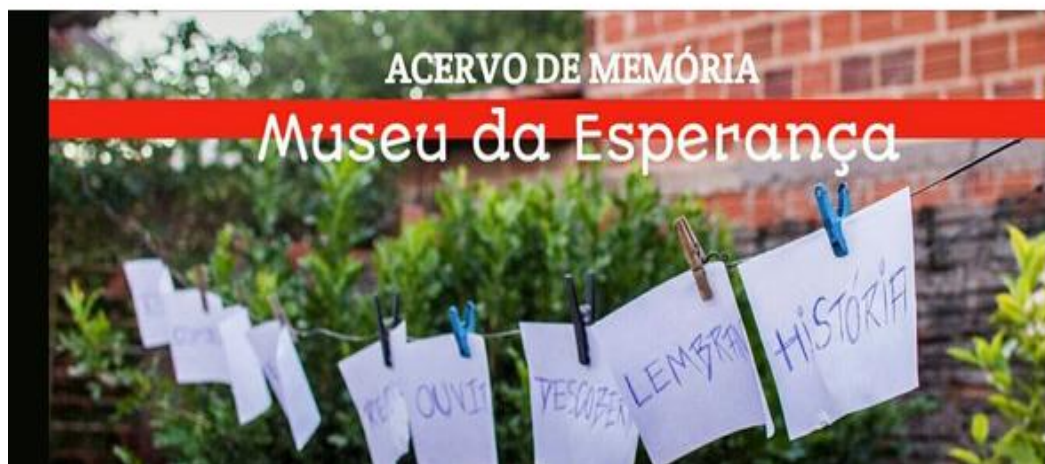
Figura 1: Reprodução da página do Facebook Lagoas do Norte Pra Quem?