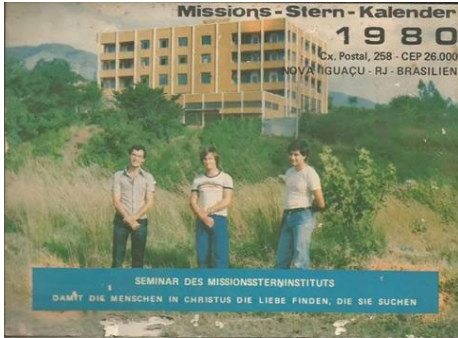
Figura 1 – Capa do calendário da CEBEM de 1980 com seminaristas e, ao fundo, o prédio do IEM.