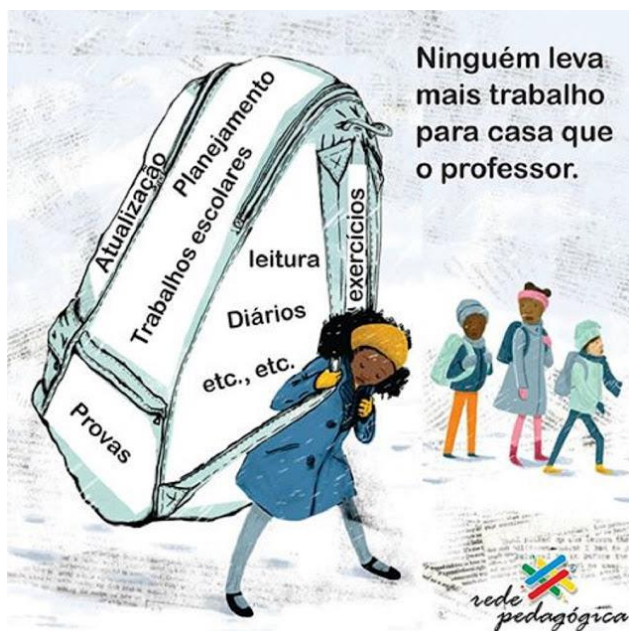
Imagem 2 - Ninguém leva mais trabalho pra casa que o professor!

Ainda a título de justificativa dessa discussão, a imagem 02, a seguir, publicada no site SóEscola , em 02 de abril de 2017, explicita bem esse cenário: