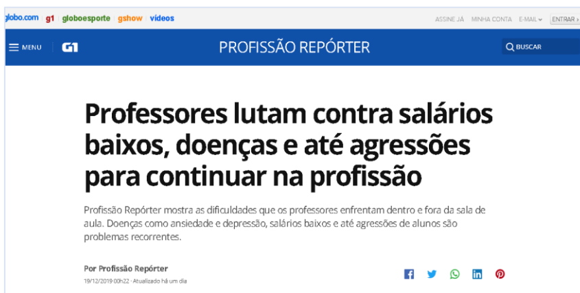
Imagem 3 - Matéria de capa do Programa Profissão Repórter exibido na TV Globo

Não raro, nos últimos anos, são recorrentes nos diferentes tipos de mídia, algumas reportagens e notícias com dados assustadores. A exemplo, o Programa Profissão Repórter , da TV Globo, exibido no dia 18 de dezembro de 2019, com o seguinte tema: