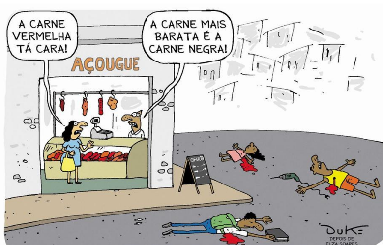
Imagem 1 - Charge O Tempo 03/12/2019