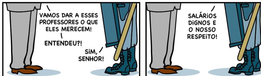
Imagem 5 - Tirinha de Armandinho

necessário à mensagem que se pretendeu defender ao longo destas páginas: