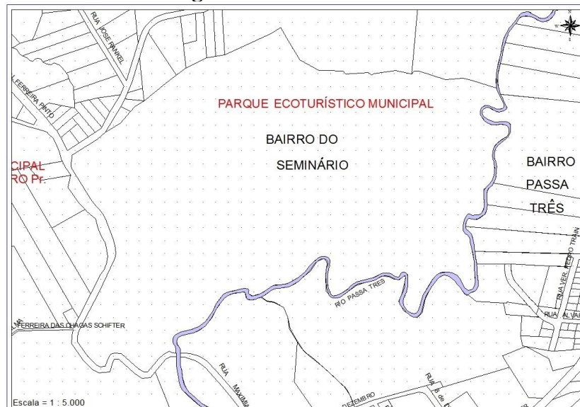
Figura 2 – Rio Passa Três