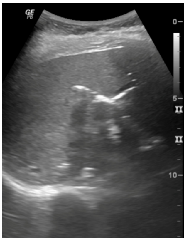
Figura 1 - Sinais de aerobilia ao exame de ultrassonografia do abdome superior da paciente. Hospital Universitário da Universidade Federal do Maranhão. São Luís, MA, Brasil, 2019.

pepsia de cerca de um mês e meio de duração e história clínica prévia de colelitíase não tratada. Ao estudo ultrassonográfico do abdome superior a vesícula biliar não foi caracterizada, no entanto foram detectados sinais que sugeriam aerobilia (Figura 1), sendo realizada tomografia computadorizada complementar que revelou aerobilia, dilatação de vias biliares e comunicação/fístula colecistoduodenal (Figura 2), condizentes com a tríade de Rigler, embora não tenha sido caracterizada litíase biliar ectópica. Foi submetida a endoscopia digestiva alta que demonstrou a presença de dois óstios no bulbo duodenal, que sugeriam derivação biliodigestiva. A paciente evoluiu com piora da sintomatologia álgica e foi internada para realização de colecistectomia videolaparoscópica e correção da fístula colecistoduodenal, com achado histopatológico de colecistite crônica acentuada fistulizada, com relato de ausência de cálculos na peça cirúrgica. Recebeu alta assintomática, após realização de ressonância magnética de controle, que não identificou mais a presença de fístula colecistoduodenal.