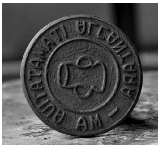
Figura 2 Clichê de identificação da origem da cerâmica, valorizando a identidade local

a face oposta do apego e valorização do local pelo mercado global e a consequente valorização do artesanato pelos “consumidores globais”; as artesãs também se inserem na globalização como consumidoras, só que pela via oposta, pelo consumo de “produtos globais”, advindos das linhas de produção chinesas, que chegam maciçamente aos lugares mais distantes do globo.