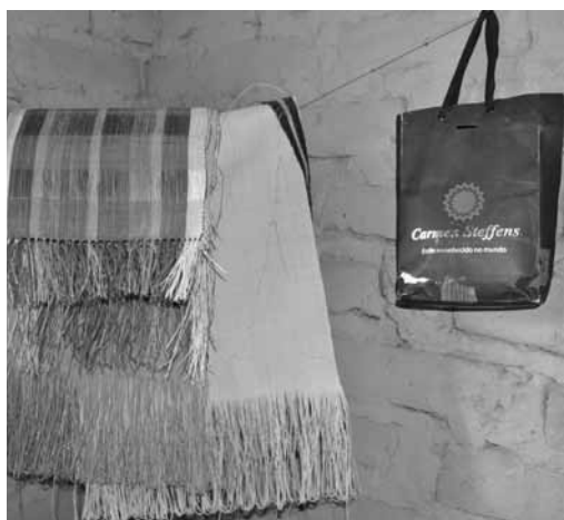
Figura 3 Duas globalizações: artesanato tradicional, desejos globais

a face oposta do apego e valorização do local pelo mercado global e a consequente valorização do artesanato pelos “consumidores globais”; as artesãs também se inserem na globalização como consumidoras, só que pela via oposta, pelo consumo de “produtos globais”, advindos das linhas de produção chinesas, que chegam maciçamente aos lugares mais distantes do globo.