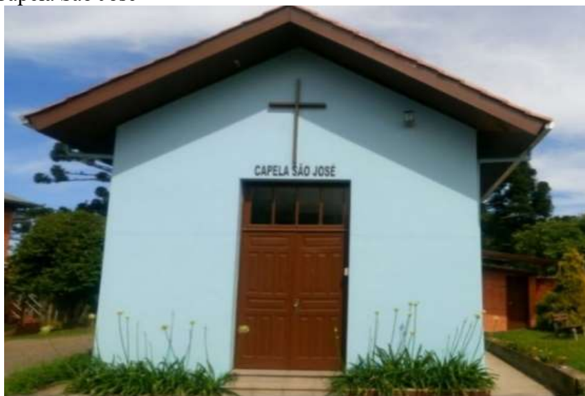
Imagem 2 - Capela São José