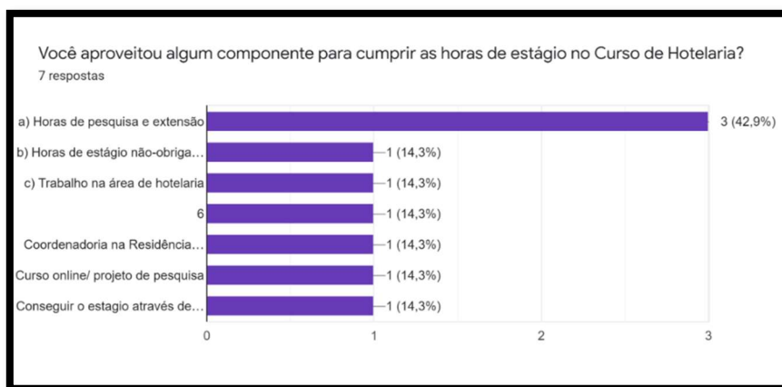
Gráfico 2 – Sobre aproveitamento de atividades complementares para cumprir horas de estágio

em projetos de pesquisa e extensão, horas de estágio não obrigatório e jornada de trabalho caso exerça alguma atividade relacionada à hotelaria ou turismo.